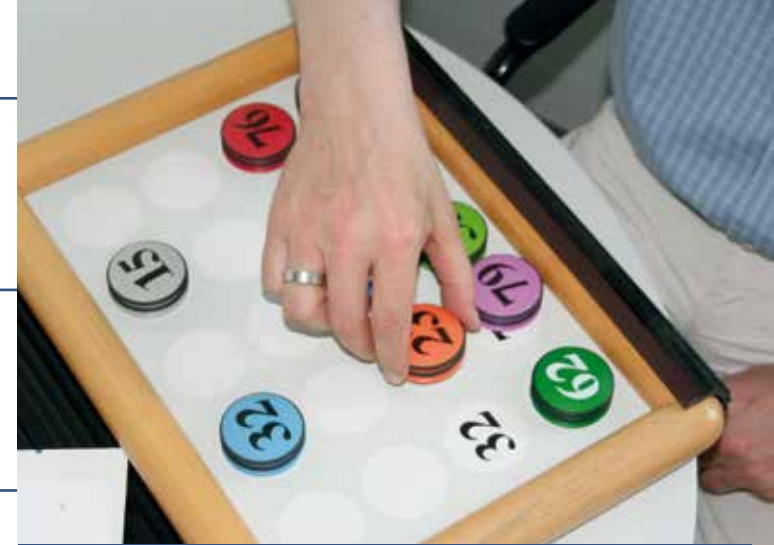
Asklepios Fachklinikum Brandenburg

Klinik für Psychiatrie, Psychosomatik und Psychotherapie