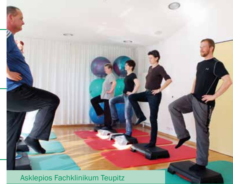
Asklepios Fachklinikum Teupitz