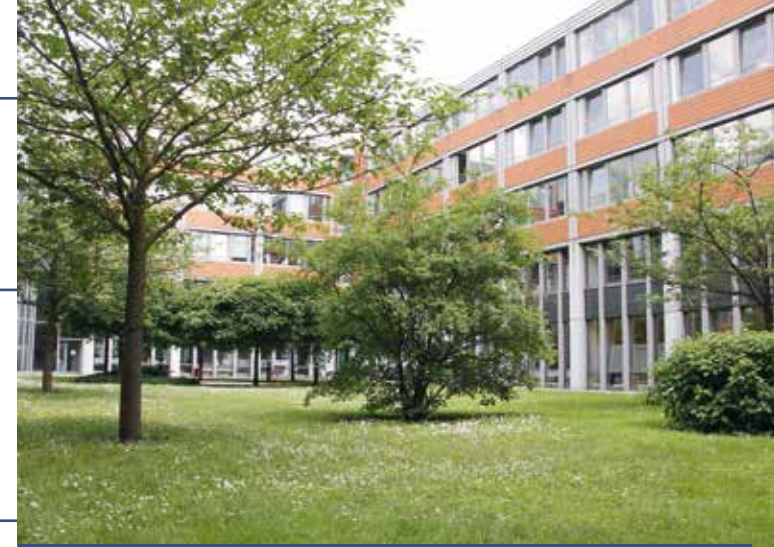
Asklepios Fachklinikum Brandenburg

Klinik für Psychiatrie, Psychosomatik und Psychotherapie