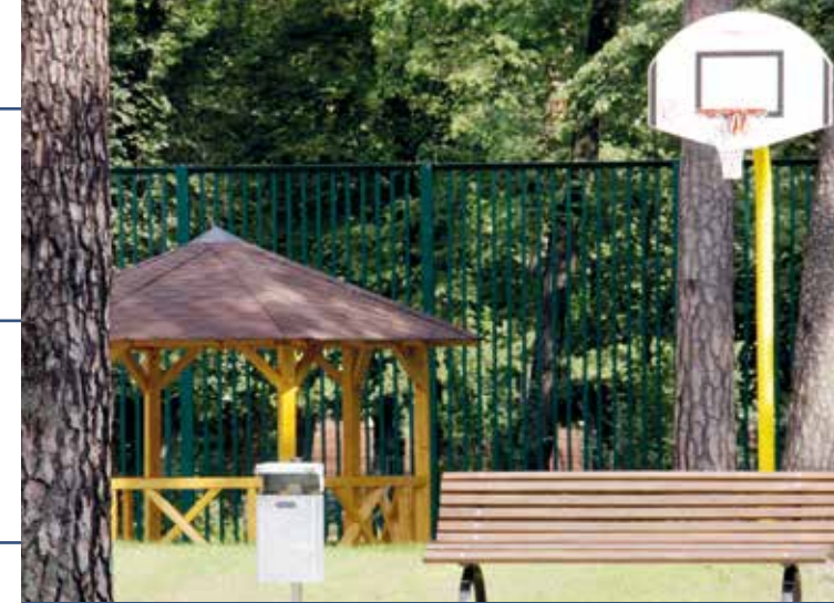
Asklepios Fachklinikum Brandenburg

Klinik für Psychiatrie, Psychosomatik und Psychotherapie