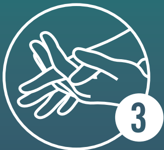
Handfläche auf Handfläche mit verschränkten, gespreizten Fingern