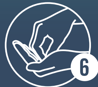
Kreisendes Reiben hin und her mit geschlossenen Fingerkuppen der rechten Hand in der linken Handfläche und umgekehrt