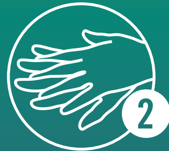
Linke Handfläche über rechten Handrücken und rechte Handfläche über linken Handrücken