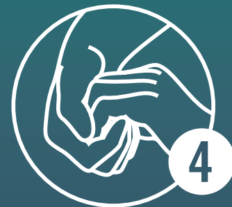
Außenseite der Finger auf gegenüberliegende Handflächen mit verschränkten Fingern