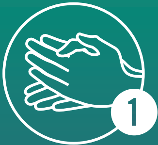
Handfläche auf Handfläche