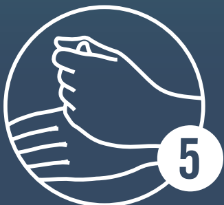
Kreisendes Reiben des linken Daumens in der geschlossenen rechten Hand und umgekehrt