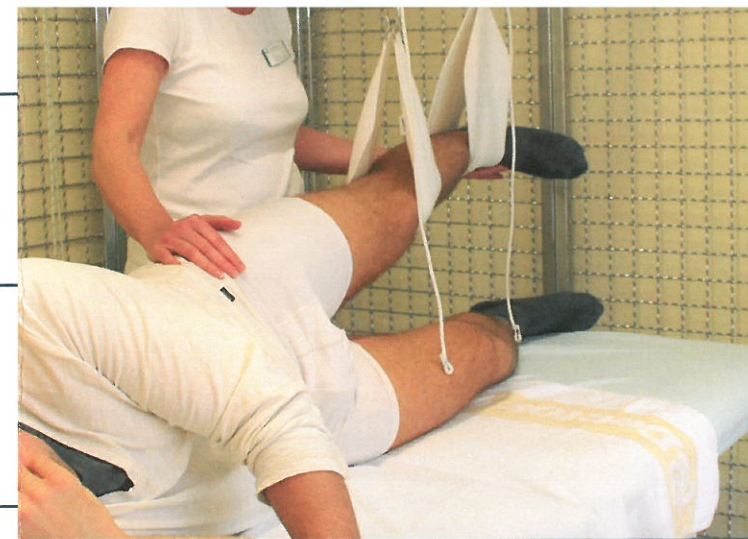
Asklepios Fachklinikum Teupitz