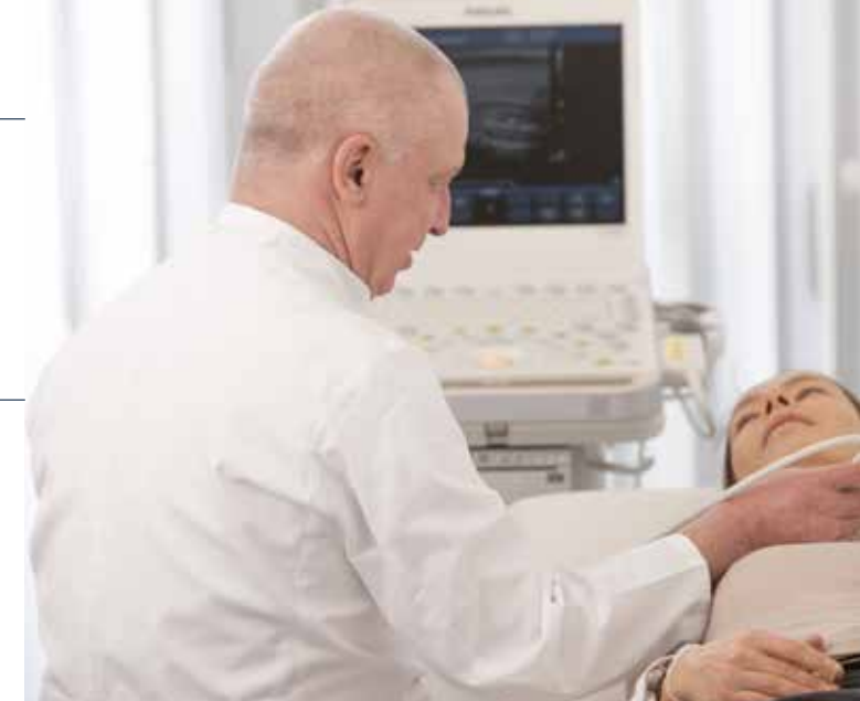
Zentrum für Schilddrüsen- und Nebenschilddrüsenchirurgie