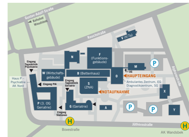
Stand: April 2021