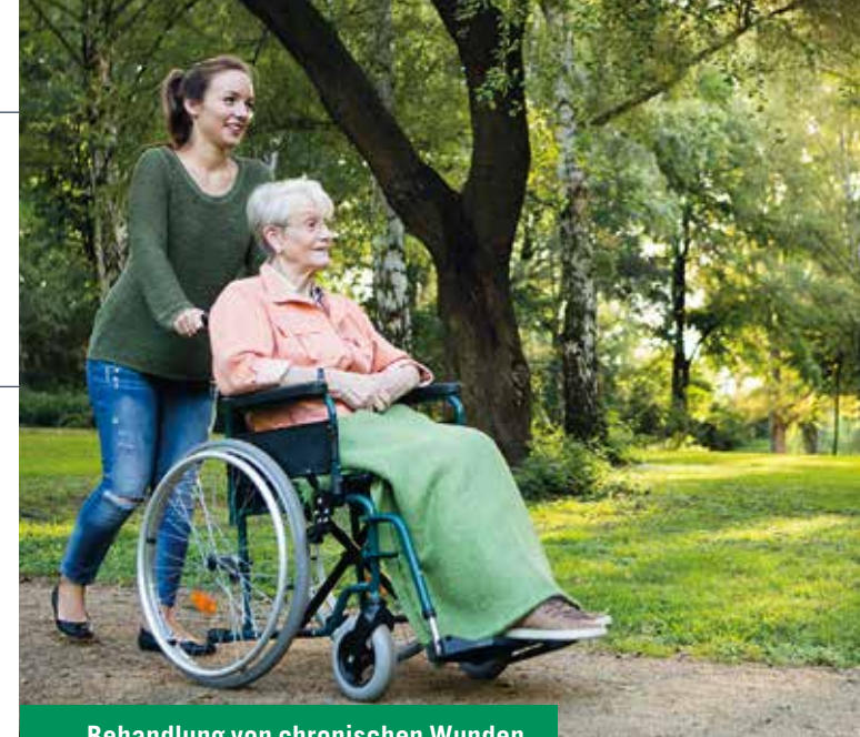
Behandlung von chronischen Wunden

Norderstraße 81 25980 Sylt/OT-Westerland Tel.: 04651 84-4420 Fax: 04651 84-464420 iaz.sylt@asklepios.com www.asklepios.com/sylt/akut